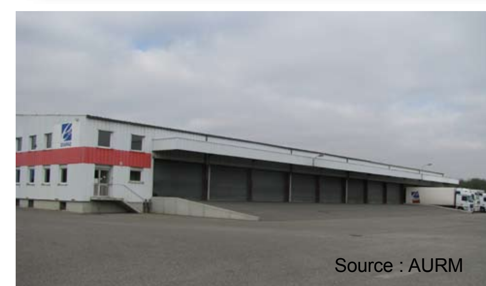
Des zones peu génératrices d'emplois et consommatrices de foncier