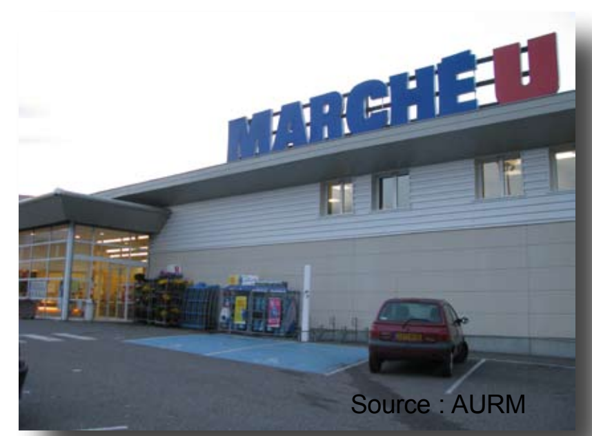
Une moyenne surface commerciale à Guebwiller

Des commerces principalement centrés sur le pôle majeur et les pôles d'ancrage du territoire.