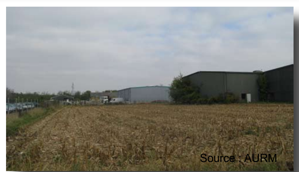
Des réserves foncières au coeur des zones d'activités