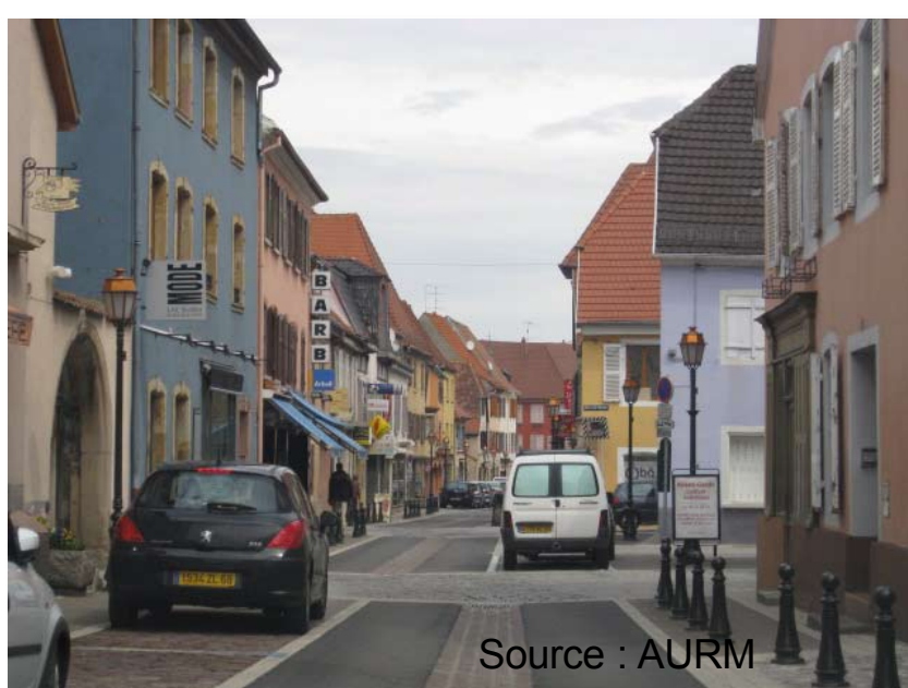
Des commerces de proximité à Rouffach