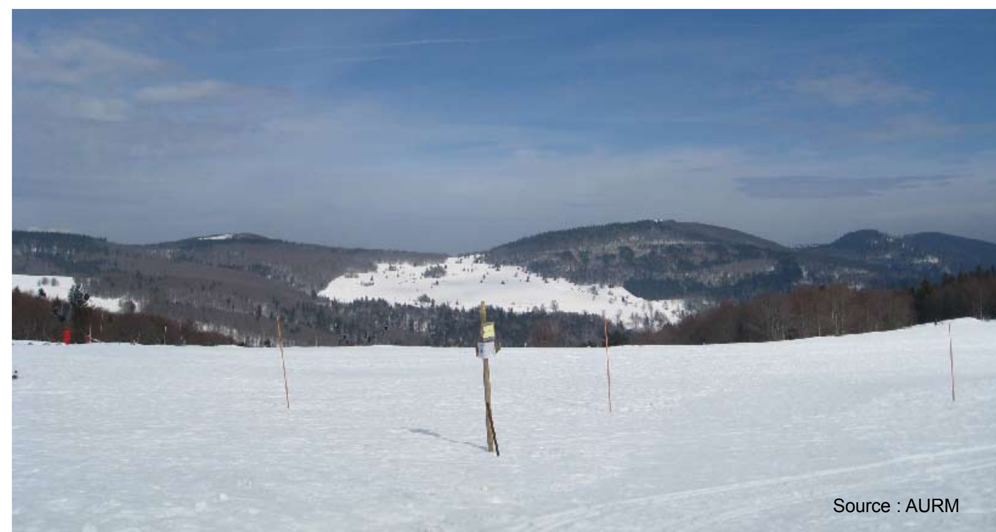
La montagne : un haut lieu touristique et sportif

Fort d'une attractivité, le territoire a enregistré entre 2004 et 2007, une hausse du nombre d'établissements touristiques (+14%) .