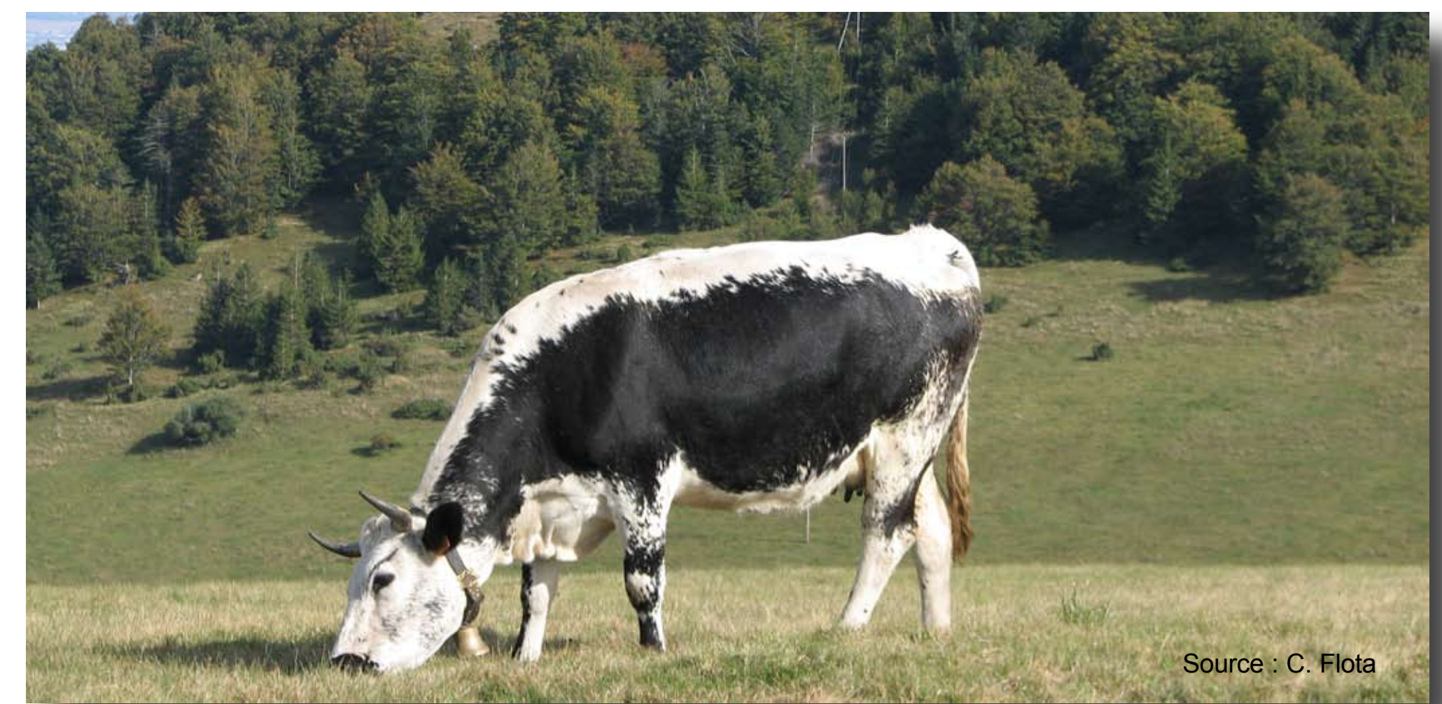
Une région à forte vocation d'élevage (AOC Munster)

Malgré un recul de 53% des exploitations et de 29% de ses effectifs entre 1988 et 2000, l'agriculture de montagne se maintient. La Surface Agricole Utile (SAU) reste stable. Les exploitations augmentent donc en taille de terres cultivables. L'agriculture se heurte à la progression de l'urbanisation. Les villages connaissent une certaine croissance urbaine menaçant notamment les prés de fauches nécessaires au maintien de l'élevage bovin. Toutefois, dans le secteur de Montagne, 36% de l'urbanisation s'effectue au sein du tissu urbain existant. Le recul des espaces agricoles est donc limité.