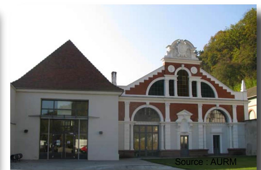
Sultz, réputée pour sa source d'eau potable