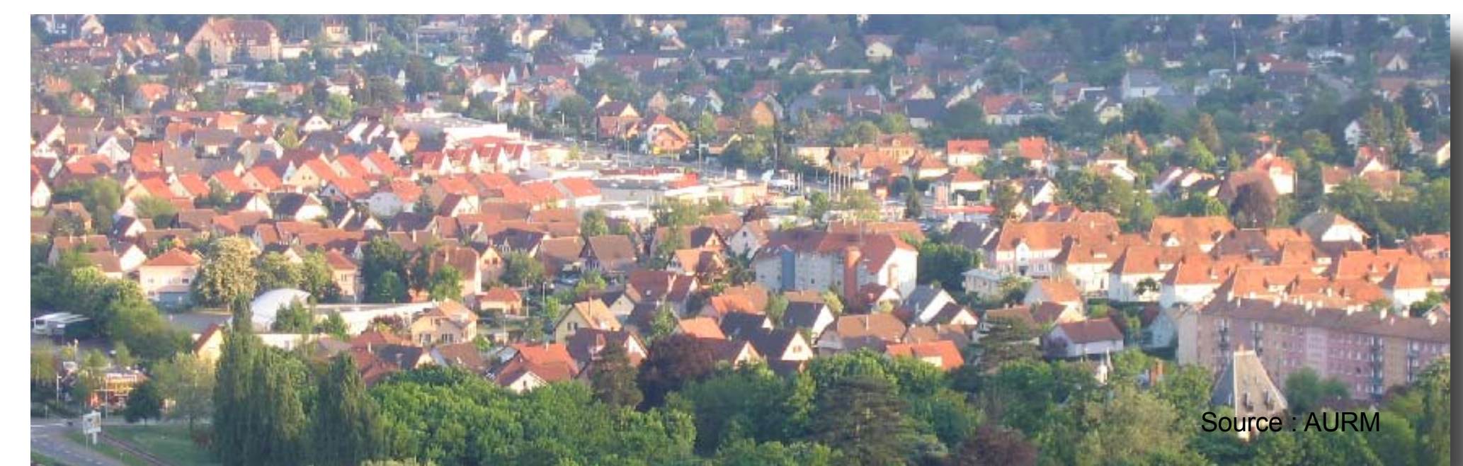
Guebwiller et son agglomération, une ville moyenne

Des espaces économiques industriels en mutation.