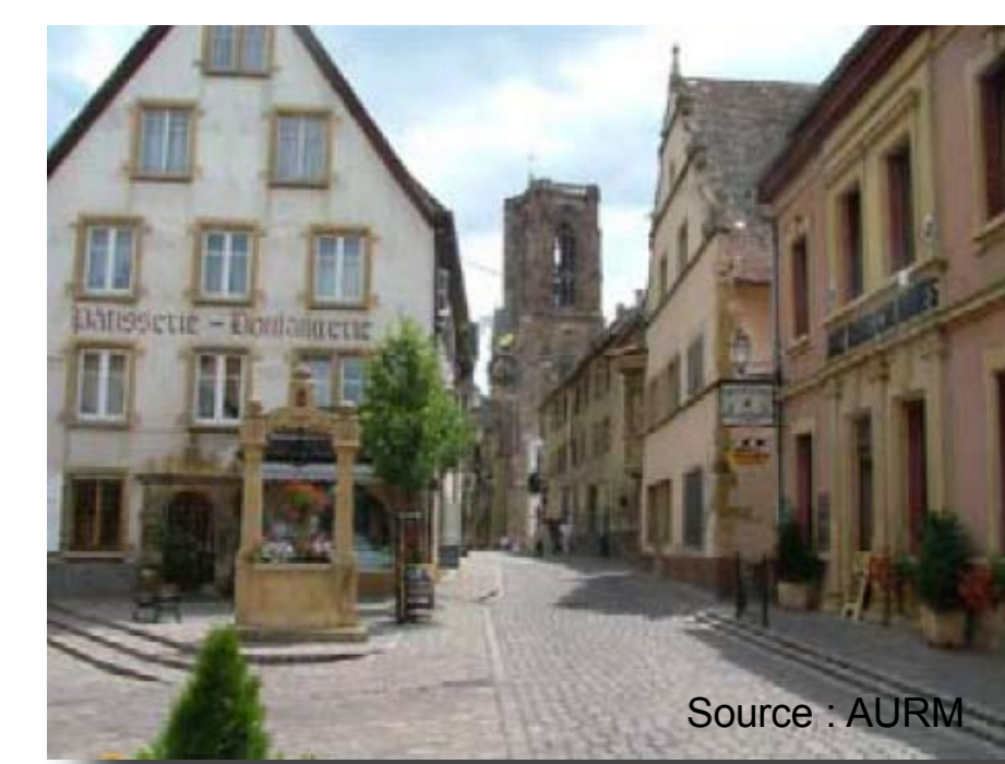
Rouffach, un gros bourg doté d'un patrimoine architectural riche