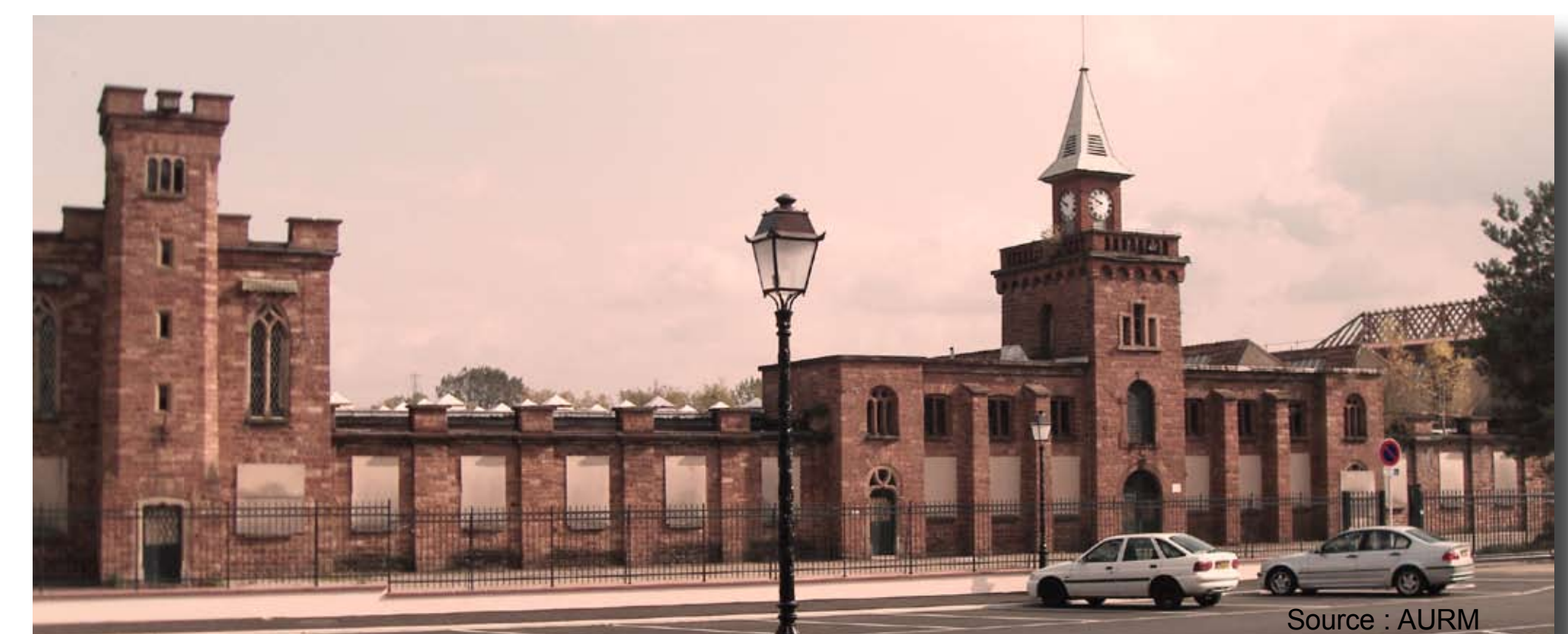
Les friches industrielles textiles principalement centrées sur Guebwiller et Issenheim